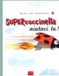
SUPERCOCCINELLA AIUTACI TU! Guido van Genechten Il Castello, 2012

Emilio si sente il re del castello di sabbia che ha costruito. Ma anche una lumaca di mare e un giovane granchio si ritengono i re di quel castello, finché arriva una grande onda.