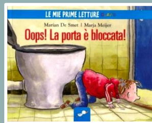
OOPS! LA PORTA È BLOCCATA M. De Smet, ill. M. Meijer Il Castello, 2012

Come può una bambina piccola nascondere un leone grande? Non è facile, ma Iris farà del suo meglio.