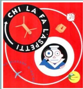
CHI LA FA L'ASPETTI Richard McGuire Corraini, 2012