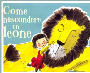
COME NASCONDERE UN LEONE Helen Stephens Nord Sud, 2012

Se per caso aveste la malaugurata idea di lanciare la bambola della vostra sorellina fuori dalla finestra solo per farle uno scherzo, preparatevi a delle conseguenze imprevedibili!